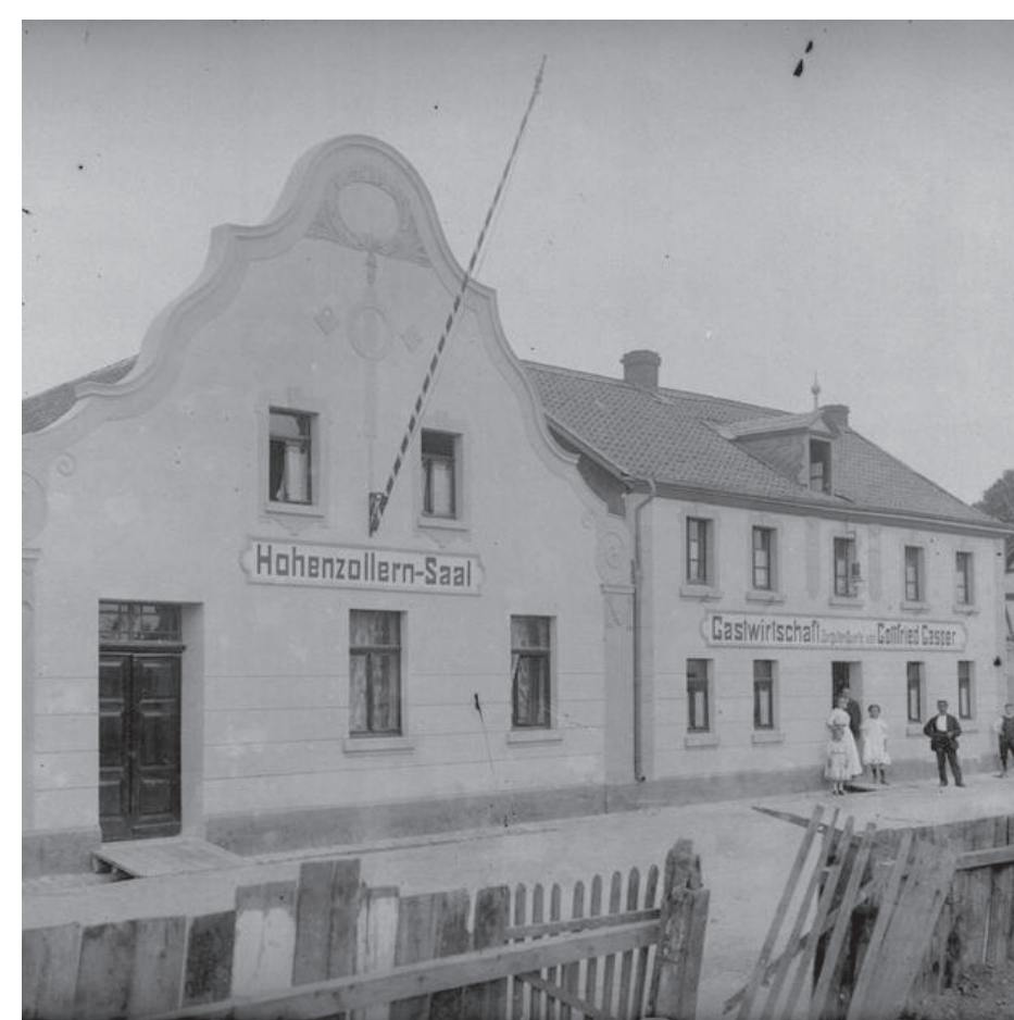
Fototafel Lindenwirtin, Frankfurter Straße