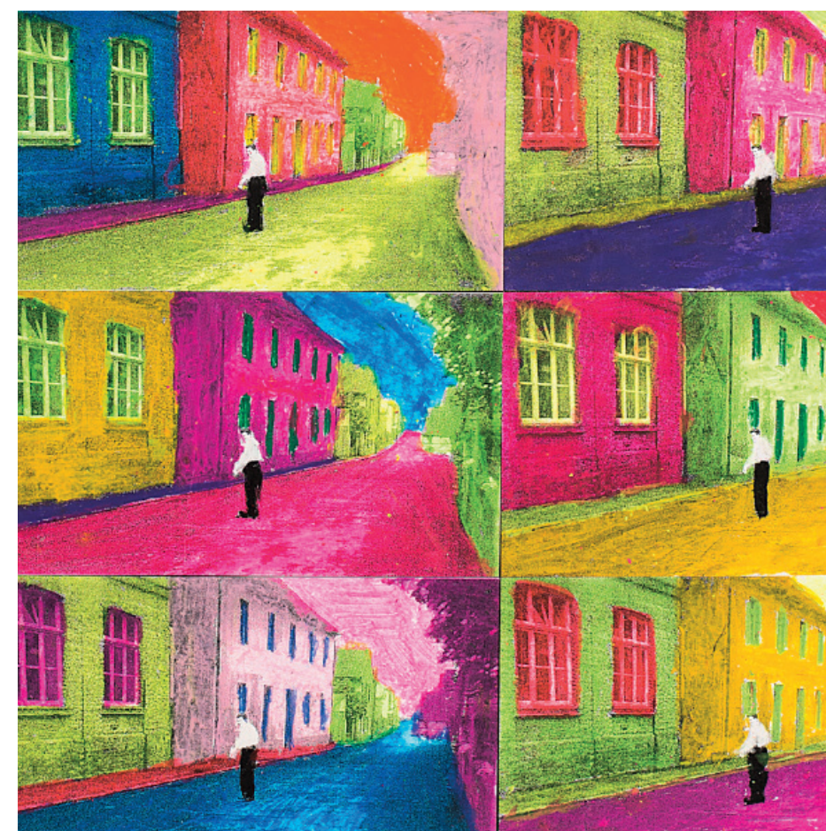
Fototafel Gemeinschaftsgrundschule, Schulstraße