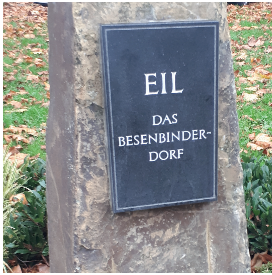
Stele „Eil das Besenbinderdorf“, Blumenbeet Bonner Straße