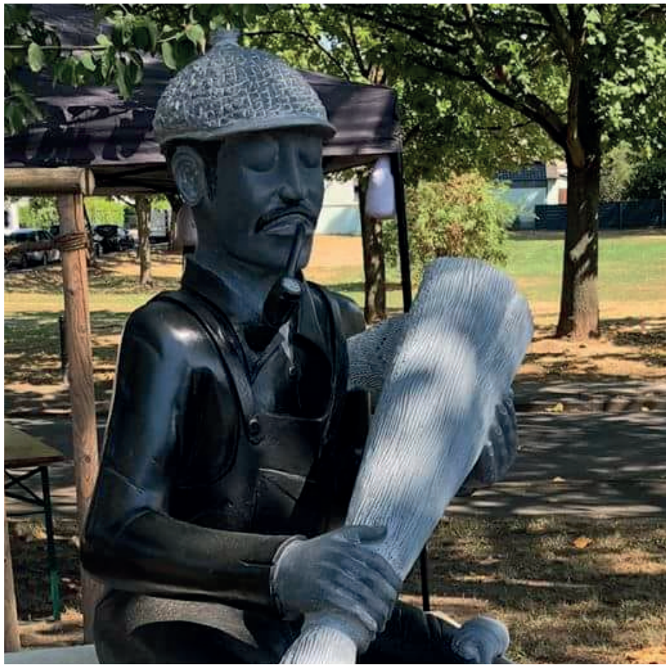
Besenbinderdenkmal auf dem Besenbinderplatz Eil