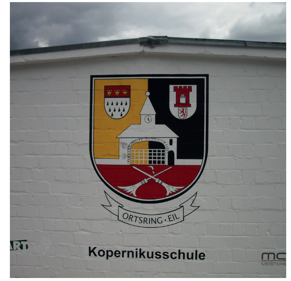
Wappen von Eil, Düsseldorfer Straße