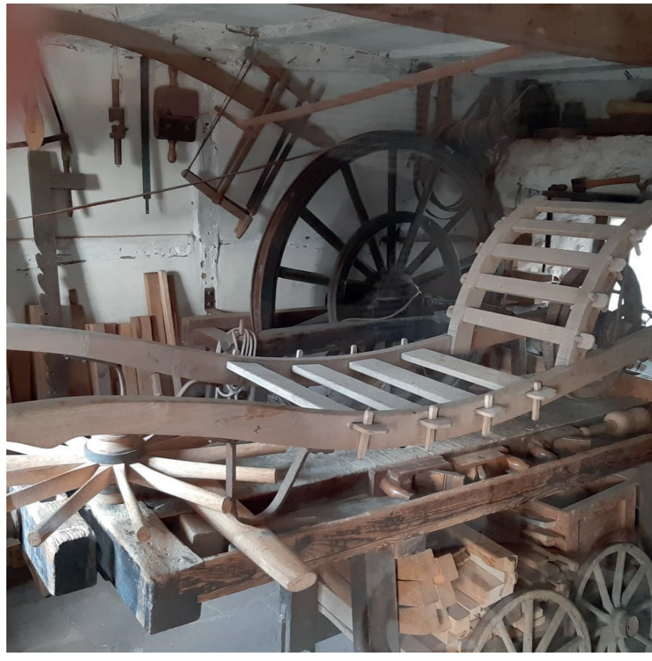
Besenbinderkarre auf dem Besenbinderplatz Eil