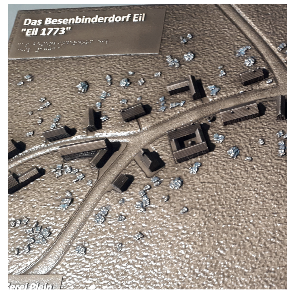
3D-Modell Das Besenbinderdorf Eil, „Eil 1773“ Pfarrer-Oermann-Platz