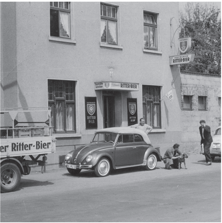
Fototafel, Bergerstraße 134