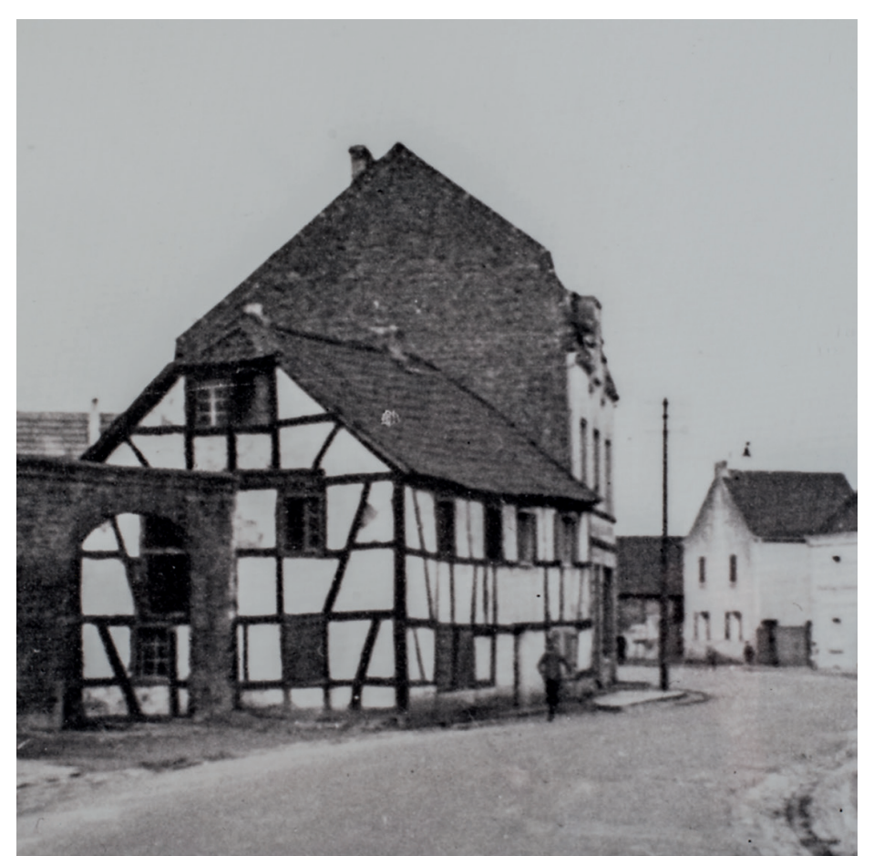
Fototafel Bäckerei Hardt, Frankfurter Straße 601