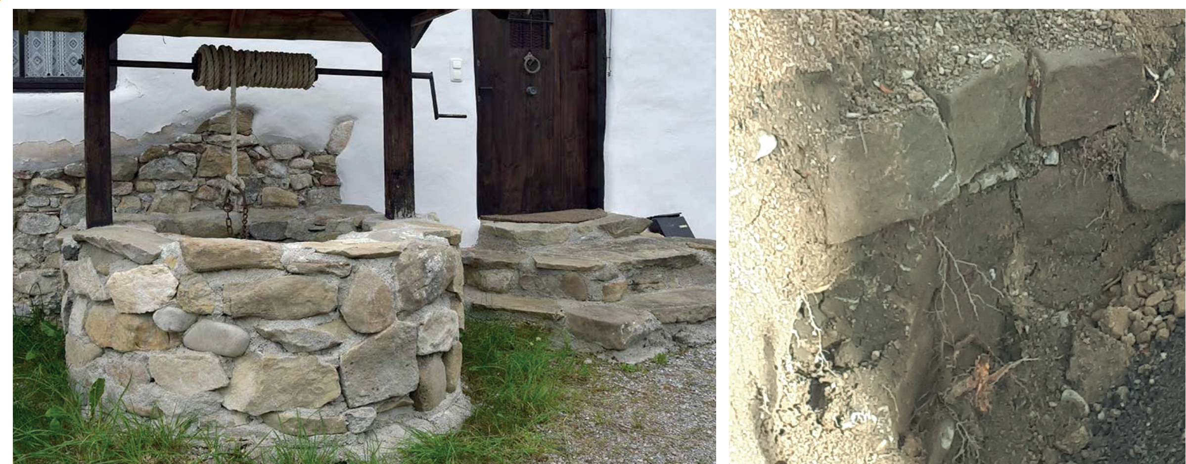
Brunnen „Spielpütz“ vor der Gaststätte Lindenwirtin