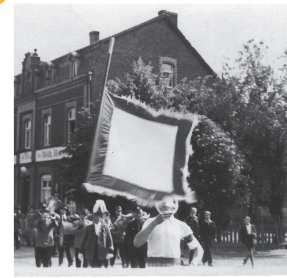
Fototafel Gaststätte Klein Eil, Frankfurter Straße