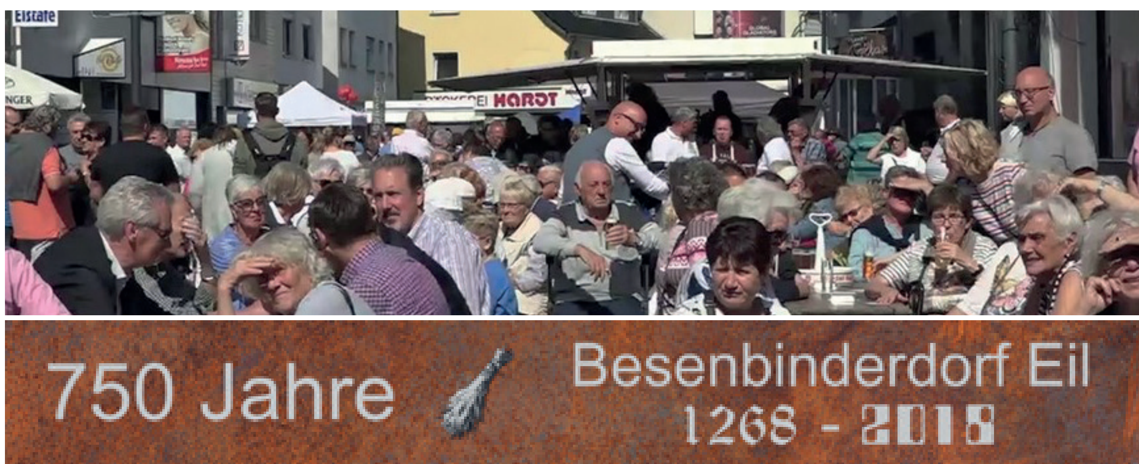
2018 750-Jahr-Feier „Besenbinderdorf Eil“ 1268 - 2018